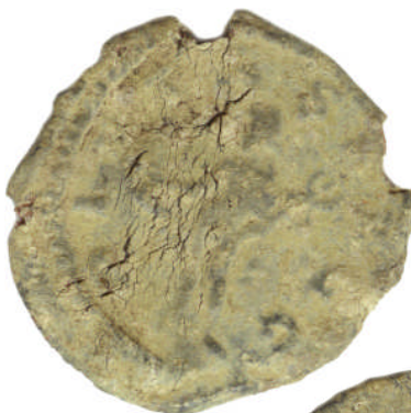
Römische Blei-Münze (Vergrößert)