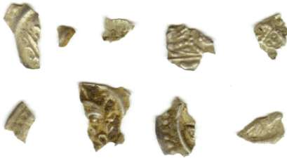
Bruchstücke von Brakteaten

Nun kann man sich natürlich die Frage stellen was soll man mit solchen Bruchstücken?