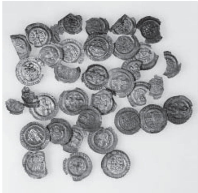
28: Cham, Oberwilerwald. Auswahl der Münzen des Fundes vom Sommer 2004.

Im Gegensatz zum Konstanzer Münzgebiet, in welchem mehrere Münzherren ihr Geld nach Konstanzer Vorbild prägten, finden sich im Zürcher Währungsraum des 13. Jahrhunderts nur drei Münzstätten Zürcher Schlags: jene der Fraumünsterabtei in Zürich sowie die im Vergleich zu dieser unbedeutenden Münzstätten der