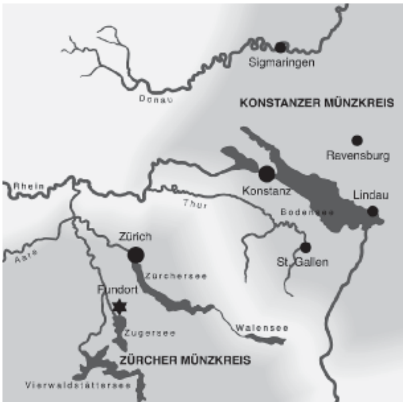
29: Cham, Oberwilerwald. Fundort und die im Fund vertretenen Münzstätten nebst Prägeort der jeweiligen Leitwährung.